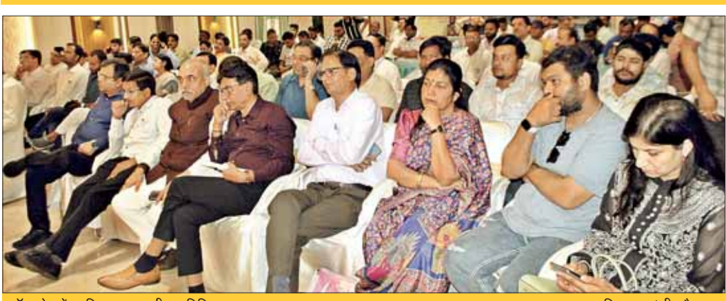
कॉन्क्लेव में उपस्थित सम्माननीय अतिथिगण।